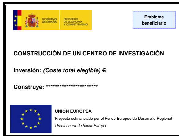
Figura 1: Ejemplo de cartel en obra de construcción

La siguiente figura muestra un ejemplo de cartel: