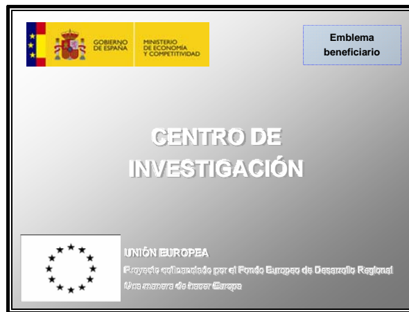
Figura 2: Ejemplo de placa explicativa en centros construidos

La siguiente figura muestra un ejemplo de placa explicativa: