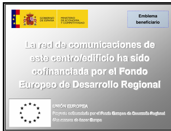
Figura 4: Ejemplo de placa explicativa en red de comunicación

La siguiente figura muestra un ejemplo de placa explicativa: